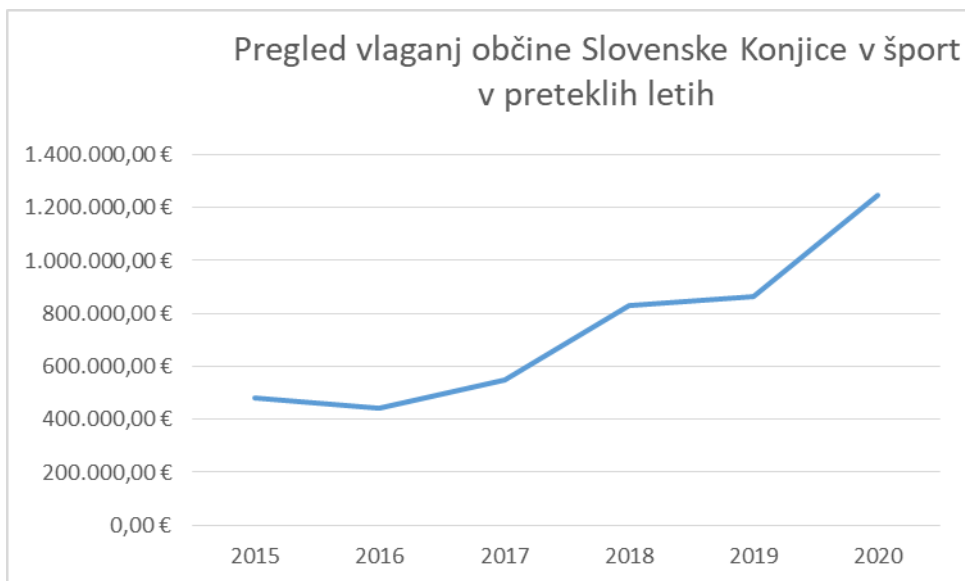
Graf 3: Pregled vlaganj Občine Slovenske Konjice v šport v preteklih letih

Podatki iz analize kažejo, da se višina sredstev, namenjenih vzdrževanju oziroma novim športnim površinam v občini Slovenske Konjice z leti viša (finančno in odstotkovno glede na višino celotnega proračuna), kar je za razvoj športa spodbudno; posledično pa dobri pogoji za delo omogočajo tudi razvoj društev, programov ter števila vključenih.